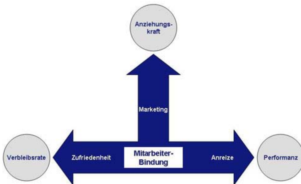
Abbildung 1: Mitarbeiterbindung ist eine entscheidende Voraussetzung für niedrige ungewollte Fluktuation bzw. hohe Verbleibsrate, für starke Anziehungskraft und Arbeitgeberattraktivität sowie für die Steigerung der Performanz des Unternehmens.

Betriebe müssen also den Spagat meistern, Talentträger auch dann bei der Stange zu halten, wenn wirtschaftliche Turbulenzen drohen oder lukrative Beschäftigungsalternativen locken. Überraschend: Dazu muss in aller Regel nicht einmal viel Geld in die Hand genommen werden.